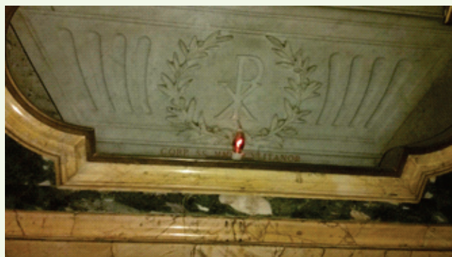
Sarcófago com as relíquias de Santa Generosa.

O Papa São João XXIII permitiu que no dia 17 de julho se celebre como festa de III classe o seu martírio.