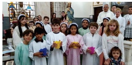
No domingo 26/05, as crianças da catequese coroaram Nossa Senhora.