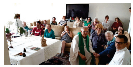
Após a celebração...