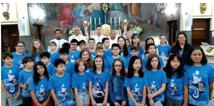
No Domingo 16/06, Missa com a participação do Colégio Maria Imaculada.