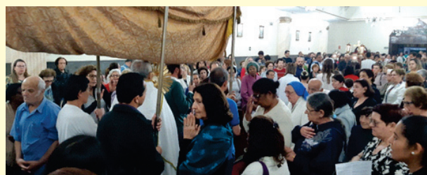
Corpus Christi: Saindo o Santíssimo da Igreja após a santa Missa.