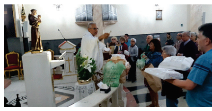
Festa de Santo Antônio: Bênção dos pães.