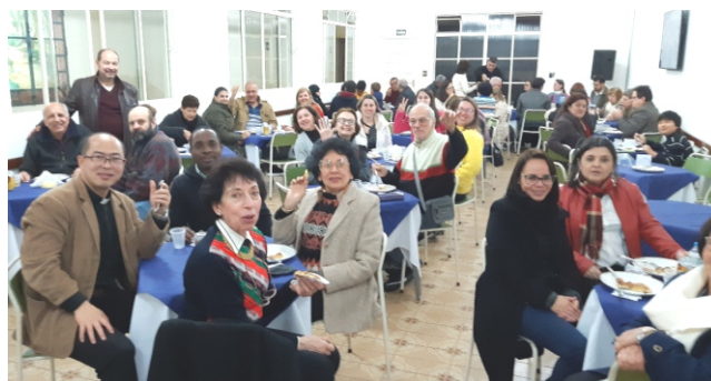
Festival de Pizzas e Esfihas, após a missa das 18h 30.