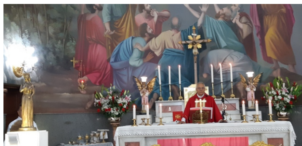
Celebrando a Santa Missa da nossa Padroeira Santa Generosa em 17 de Julho.