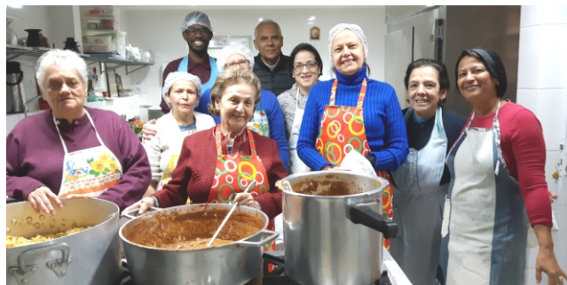
'Galinhada', servida após a missa das 12h 15.