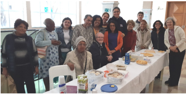
29 de Setembro: Durante o retiro espiritual no Colégio Maria Imaculada