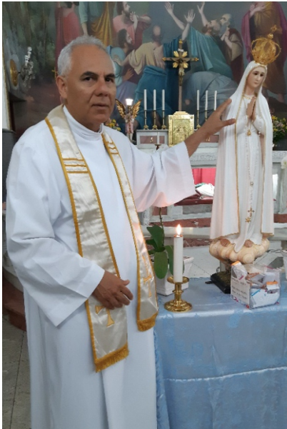
12 de Outubro: Visita da imagem de Nossa Senhora de Fátima, vinda de Portugal.