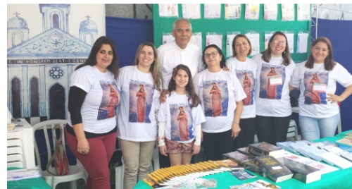
Barraca da Igreja.