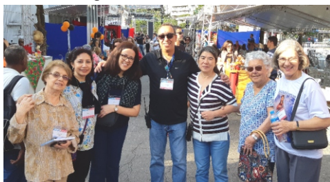
Durante a festa...