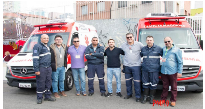
Com o grupo de apoio da Prevent Senior: