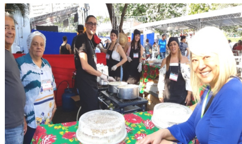
Barraca de Santa Generosa e seus deliciosos bolos...