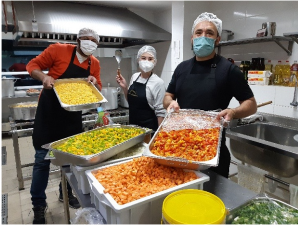
01 de Agosto: Preparando a galinhada...