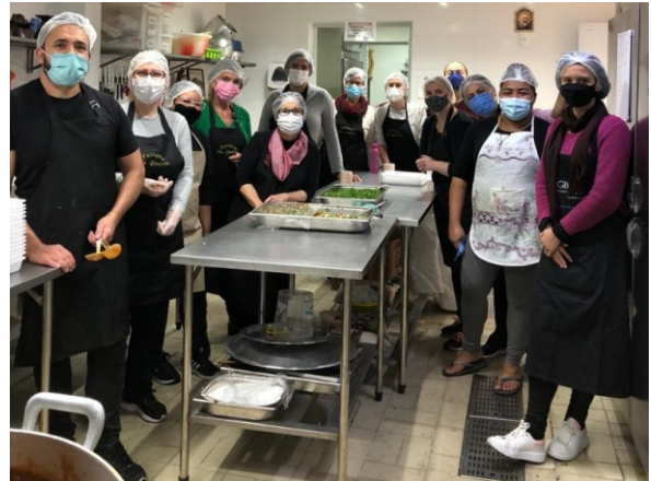
A equipe que colaborou no delicioso almoço