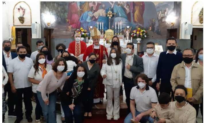
Grupo de 23 adultos que foram crismados.