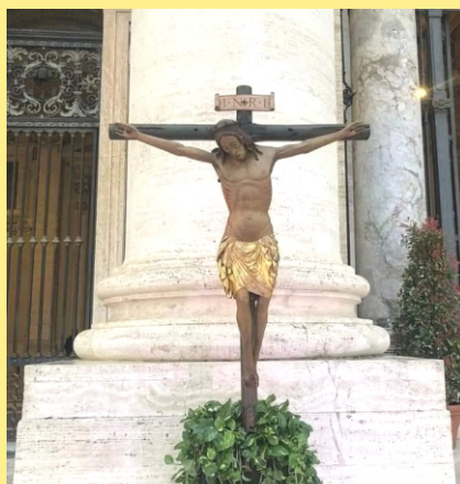
Crucifixo Milagroso levado ao Vaticano 26/03/2020.

Ó irmãos meus, vinde, acorrei todos, cheios de esperança a este cimo ensanguentado, agora podemos todos salvar-nos se o quisermos. Amém.