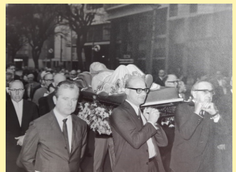
Translado da imagem de Santa Generosa para a nova igreja 09/1970