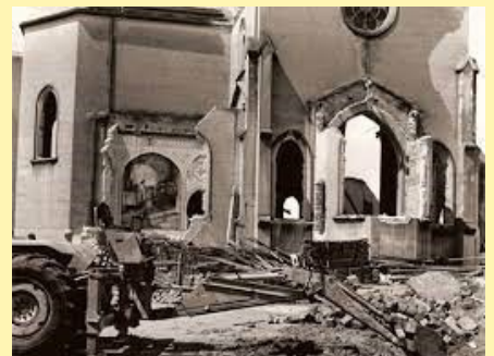
Demolição da antiga igreja Santa Generosa 12/1968