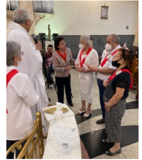
Apostolado da Oração de Santa Generosa

Feijoada beneficente – No dia 25 de setembro reserve o seu almoço para uma deliciosa feijoada promovida pela Paróquia. Em breve, traremos mais informações.