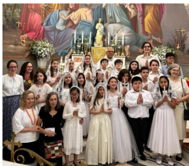
Primeira Eucaristia das crianças da catequese paroquial, 08/12/24.